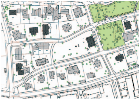
Denkmalschutz, Dachformen, Baumbestand